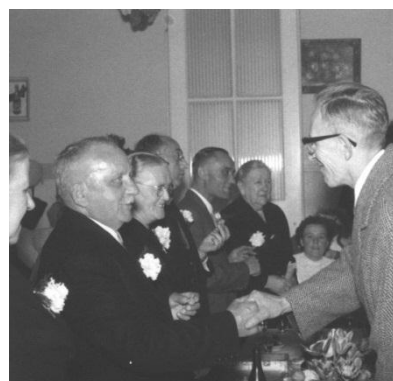
Een trotse opa en oma laten zich feliciteren ter gelegenheid van hun vijftigjarige huwelijk

man, zowel voor zichzelf als voor anderen. Hij was trots op zijn gezin, zijn bedrijf en op wat er bereikt was.