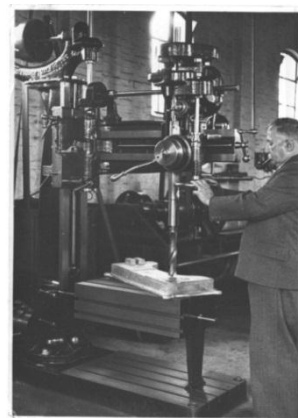
Opa in 'de werkplaats'

Opa stichtte zijn eigen bedrijf en bouwde het gezamenlijk met zijn zoons op. De Firma H.B. Löring en Zonen - Machinefabriek en Revisiebedrijf te Mierlo-Hout verwierf een goede reputatie in de wijde omgeving van het industriële Helmond. Opa was een harde werker, gerespecteerd vakman en vooral ook ondernemer. Hij was een strenge