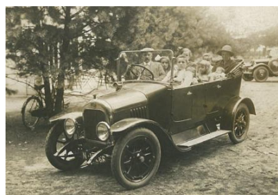
Gezinsuitstapje in het jaar 1927

Een echt groot gezin naar katholiek voorbeeld. Twee kinderen overleden in hun eerste geboortjaar. Het gezin was zeker niet als armlastig te beschouwen. In de jaren twintig waren ze in het bezit van een heuse auto. Een enorme luxe in deze tijd. Met het gezin werden o.a. ritjes gemaakt naar Uden, Enschede en Duitsland. Opa was een echte technicus, toen een noodzaak voor